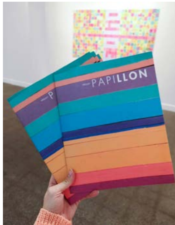
Exposition-témoignage et publication, Projet Papillon de Catherine LISI-DAOUST, 2018.