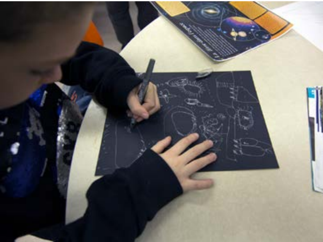
ArAMiS à l'école Sainte-Hélène, Saint-Henri-De-Taillon.