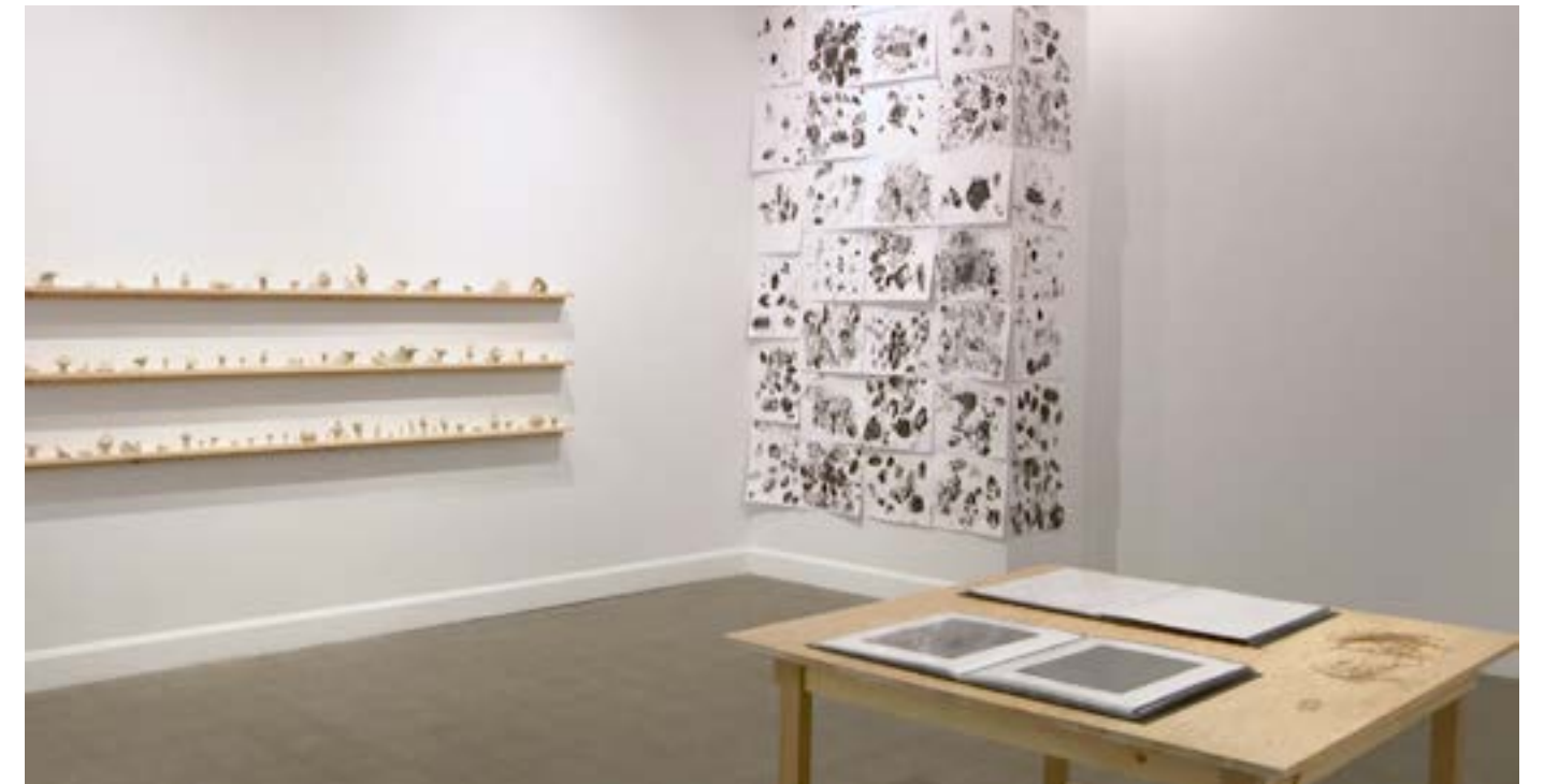
ArAMiS à l'école Notre-Dame d'Alma. Photo de Melissa Corbeil, 2019.

Par ses projets particuliers, Langage Plus souhaite participer activement au développement professionnel des artistes qu'il accompagne. En plus de pouvoir mener un projet d'envergure sans s'encombrer des charges administratives, de la coordination ou de la recherche de financement, l'artiste tirera plusieurs bénéfices à sa collaboration avec le centre.