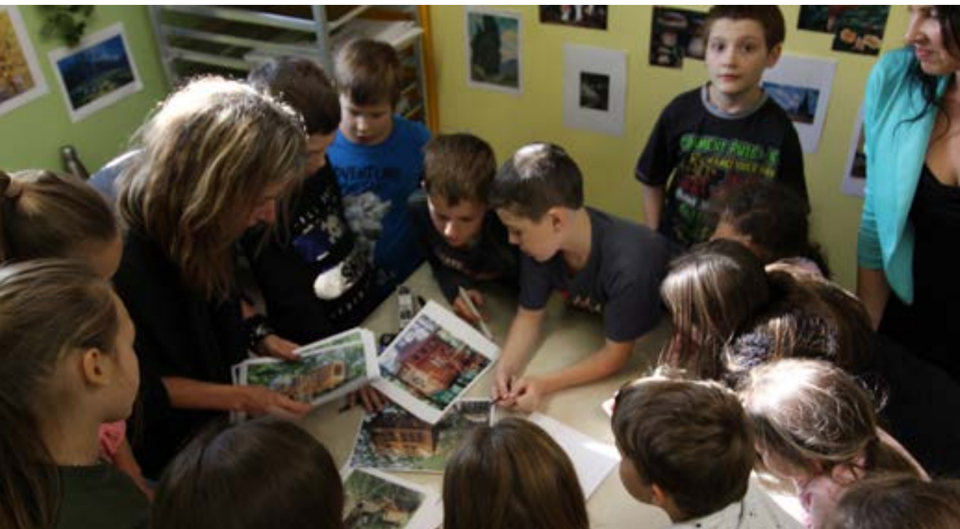
ArAMiS à l'école Sainte-Hélène, Saint-Henri-De-Taillon. Photo de Melissa Corbeil, 2019.